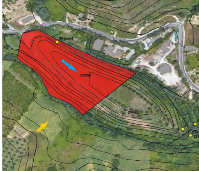
Fig.1: Prima Sorgente acque sotterranee